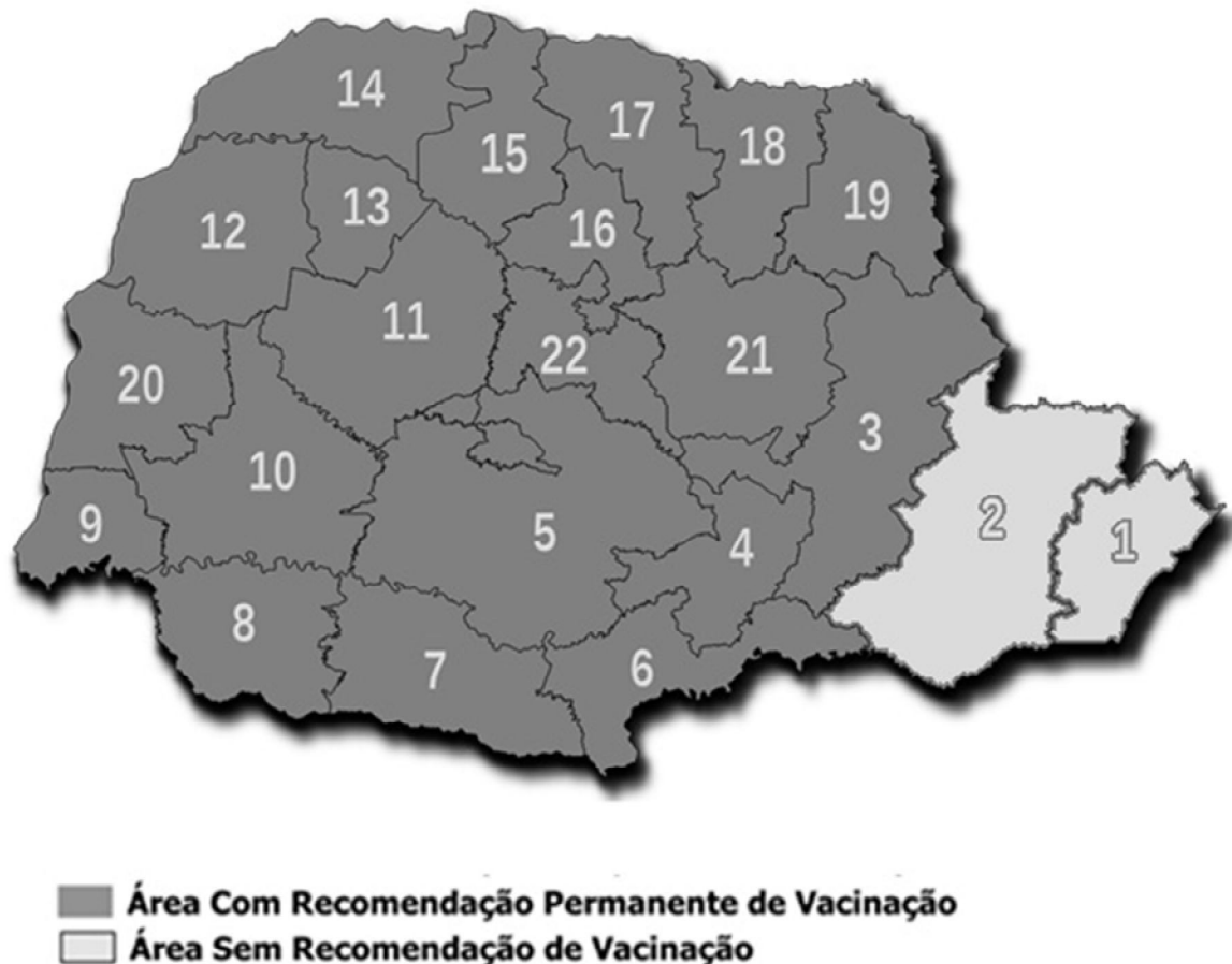
Mapa 2. Regionais do Paraná e respectivas áreas com e sem recomendação de vacina contra a febre amarela