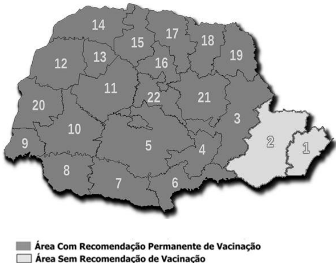
Mapa 2. Regionais do Paraná e respectivas áreas com e sem recomendação de vacina contra a febre amarela