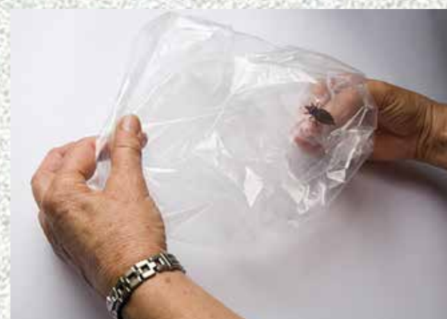
FIGURA 3. INVERTENDO O SACO PARA PRENDER O INSETO.