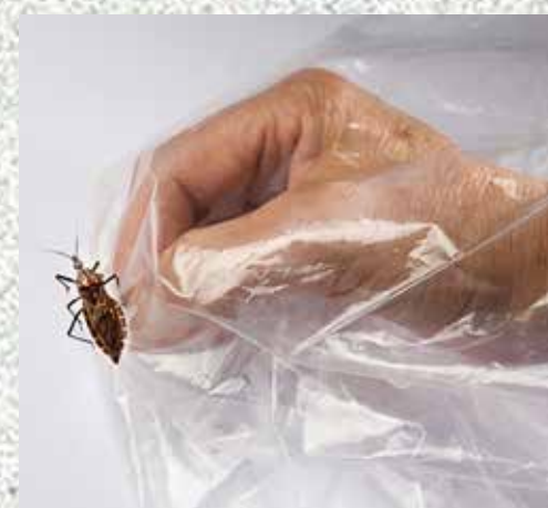
FIGURA 2. MANUSEANDO O INSETO.