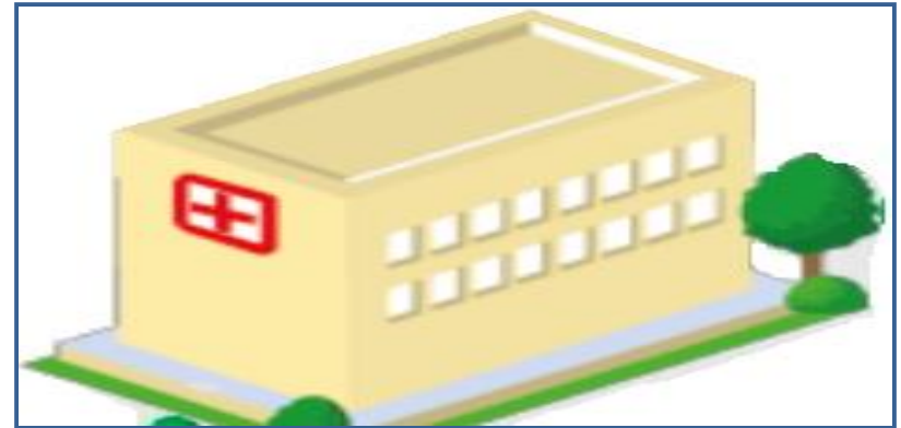
Farmácia – FE da Regional de Saúde